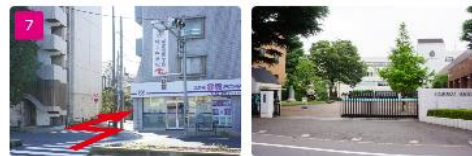
7 信号を右折し、そのまま直進で城北学園正門へ