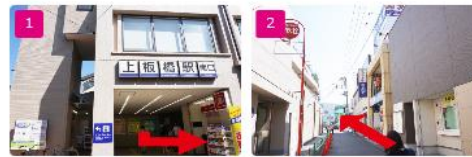
1 東武東上線 上板橋駅南口、階段を降りて左折