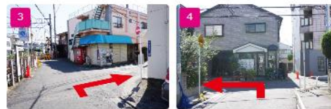
3 踏切の手前を右折